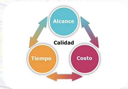
Diseño y gestión de proyectos