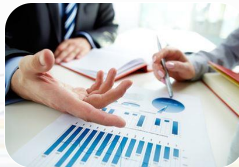
Consultoría y asesoría especializada