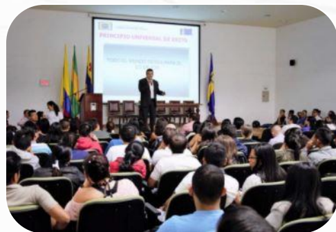
Organización de eventos científicos y académicos