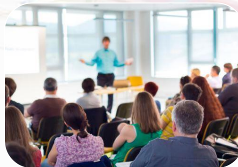
Programas de capacitación